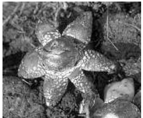
Les « branches » de cette étoile des terrils ou astrée hygrométrique se referment (vers l'intérieur) par temps plus sec.