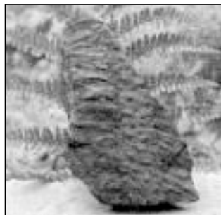
Nous avons trouvé de tels fossiles sur notre terril lors de notre promenade avec nos correspondants de Thuin le 20 avril 2001.

Dans le cas des plantes, ce sont les parties dures qui se fossilisent.