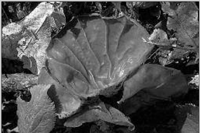
Une oreille de Judas ( Auricularia auricula-judae ) détachée de son support qui est, le plus souvent, une branche morte de sureau noir ( Sambucus nigra ).

Les oreilles se multiplièrent comme les champignons, et depuis ce temps, on en trouve beaucoup sur les sureaux.