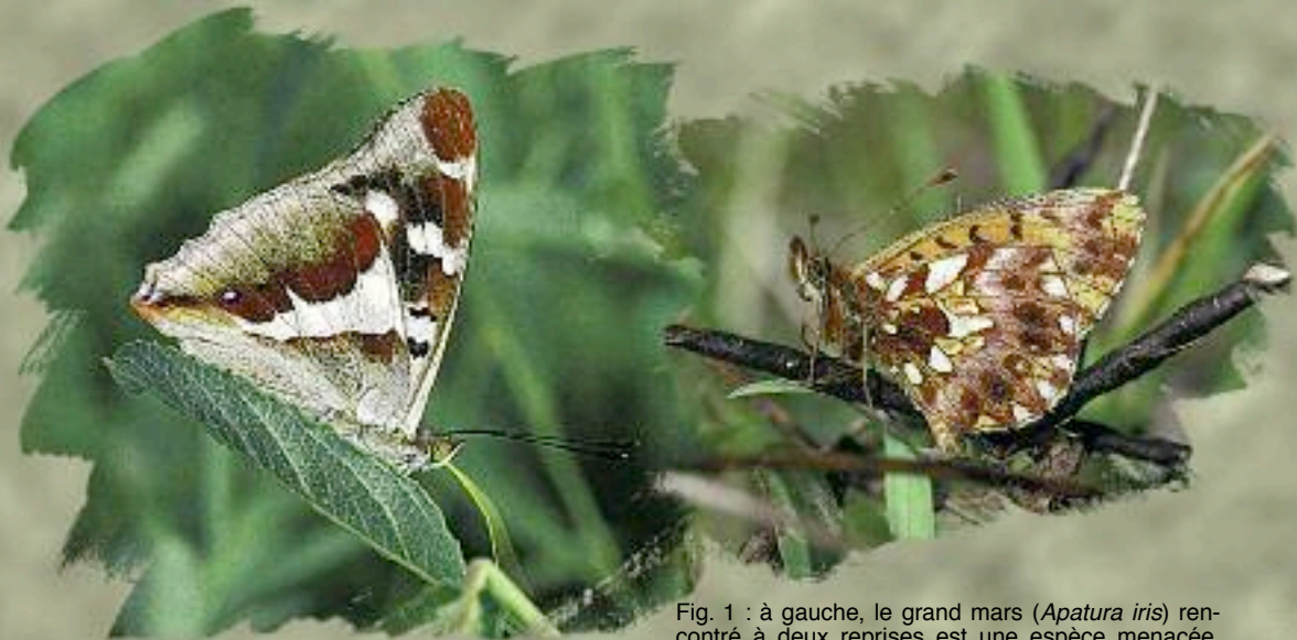
Fig. 1 : à gauche, le grand mars ( Apatura iris ) rencontré à deux reprises est une espèce menacée, mais à faible risque, en comparaison, à droite, de la petite violette ( Clossiana dia ) qui est en réel danger.