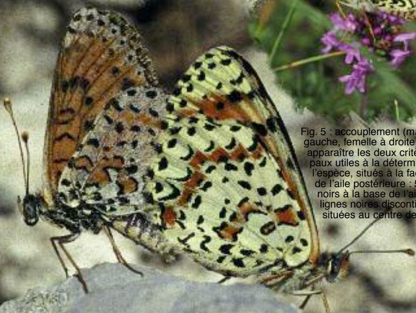
Fig. 5 : accouplement (mâle usé à gauche, femelle à droite) laissant apparaître les deux critères principaux utiles à la détermination de l'espèce, situés à la face inférieure de l'aile postérieure : 5-6 points noirs à la base de l'aile et deux lignes noires discontinues, situées au centre de l'aile.