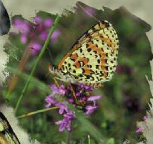
Fig. 4 (ci-dessous) : face inférieure de la femelle de la mélitée orangée.