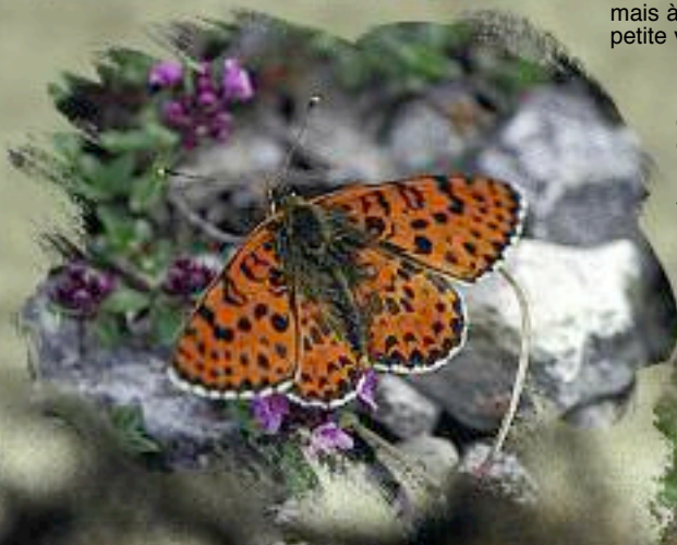
Fig. 3 (à gauche) : face supérieure du mâle de la mélitée orangée ne permettant aucune confusion.