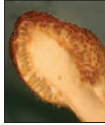
Coupe longitudinale de la tête montrant une série de sacs de forme ovale (périthèce) s'ouvrant par un pore et dans lesquels les cellules fertiles ou asques (contenant les spores) sont arrangées.