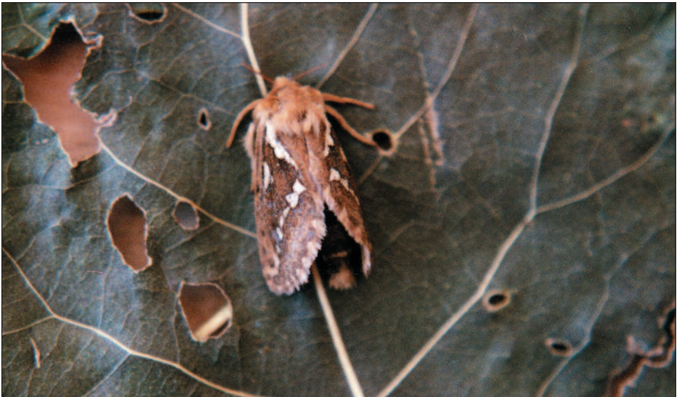
Commune et répandue, la Louvette peut être un fléau pour les plantes cultivées. Elle se reconnaît à l'aide de ses ailes allongées, ses très courtes antennes et ses tons allant du blanc crème au gris brun.