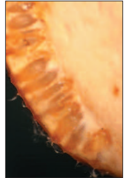
Détail des périthèces ovales