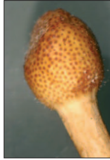
Vue rapprochée de la surface de la tête du sporophore, montrant les pores (sombres et encore fermés) des périthèces