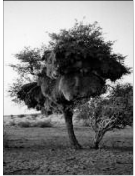
Acacia erioloba avec nids de tisserins.

graisses et protéines, nourriture principale des oryx et autres antilopes est un arbre atteignant souvent la quinzaine de mètres, hauteur favorable aux girafes qui broutent son feuillage de couleur vert-bleu, émaillé dès le début du printemps austral de petites fleurs jaunes en boules d'un centimètre et au parfum sucré, et ce malgré des épines blanchâtres acérées de 5 cm de long, d'où le nom plus souvent employé de « camelthorn », la girafe étant un camélidé. Son bois très foncé, très dur a été largement utilisé par la population autochtone, les Bushmen pour de nombreux fabricats, bois de feu et de construction. La sève nourrit aussi des petits animaux comme les galagos ou les rats des arbres. L'acacia peut vivre plusieurs dizaines d'années mais s'écrouler aussi sous le poids des nids accumulés de colonies de tisserins qui lui donnent des allures de lampadaires. De plus, lorsque la faune prédatrice devient trop exigeante en cas de sécheresse, il existe une prévention mutuelle par émission de parfum et augmentation de toxicité du feuillage, mortelle pour les prédateurs. Enfin, il a toujours servi de refuge élevé et ombragé par une cime parasol, pour beaucoup d'animaux et pour des peuples autochtones préhistoriques ou récents.