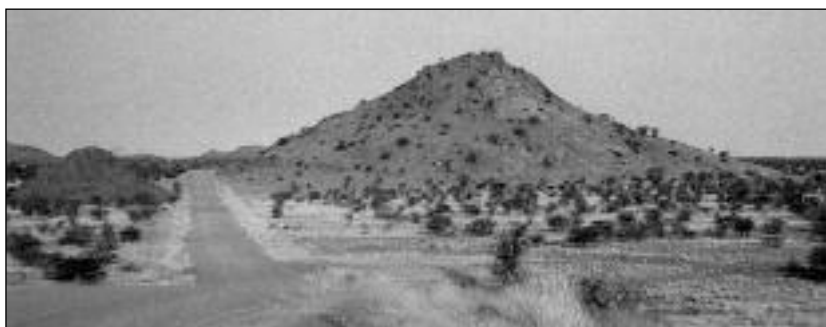
Inselberg (colline résiduelle d'un plateau granitique).

Le désert rocheux, à gravier épars ou Reg est obtenu par le vannage par le vent de la matrice fine composée cependant parfois d'éléments pouvant atteindre 5 cm. Dans les reliefs résiduels on trouve des granites particuliers – notamment à 70 km à l'est de Swakopmund – appelés « alaskites » très riches en quartz, feldspaths et uranium et qui peuvent parfois être escaladés partiellement ou totalement par les vents apportant du sable.