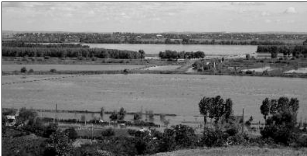
Le Danube et ses débordements.