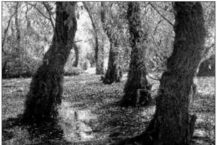
Forêt rivulaire.

Le delta du Danube est traversé par le 45 e parallèle de l'hémisphère boréal, situé à mi-distance entre l'équateur et le pôle Nord, carrefour idéal pour les oiseaux migrateurs. La plus représentative de ces espèces et la plus exceptionnelle en Europe est certainement le pélican, dont deux espèces vivant en sympatrie sur le delta du Danube en quantité telle que ce seul argument suffit à protéger intégralement cette zone d'Europe, capitale pour ces espèces dont le rare pélican frisé (200 couples en Roumanie au début du xx e siècle) avec aujourd'hui une population estimée à une centaine de couples sur les 3 000 couples environ que compte encore le monde. En ce qui concerne le pélican blanc, sa population n'est pas spécialement menacée au vu de son importante population africaine estimée entre 40 000 et 75 000 couples. Dans le delta, les derniers recensements ont permis d'établir une population de 2 500 à 3 000 couples nicheurs, mais il existe de nombreux oiseaux immatures qui vivent sur les lacs avant d'atteindre la maturité sexuelle pour nicher. La principale colonie de pélicans blancs niche au nord du complexe du delta au bord d'un lac strictement protégé dans la réserve de Rosca-Buhaiova; ils établissent leurs nids sur ces amas de végétation déjà décrits plus haut, les « plaurs » qui présentent le double avantage de ne pas être facilement accessibles aux mammifères prédateurs des œufs et des jeunes et d'être à l'abri des variations du niveau des eaux.