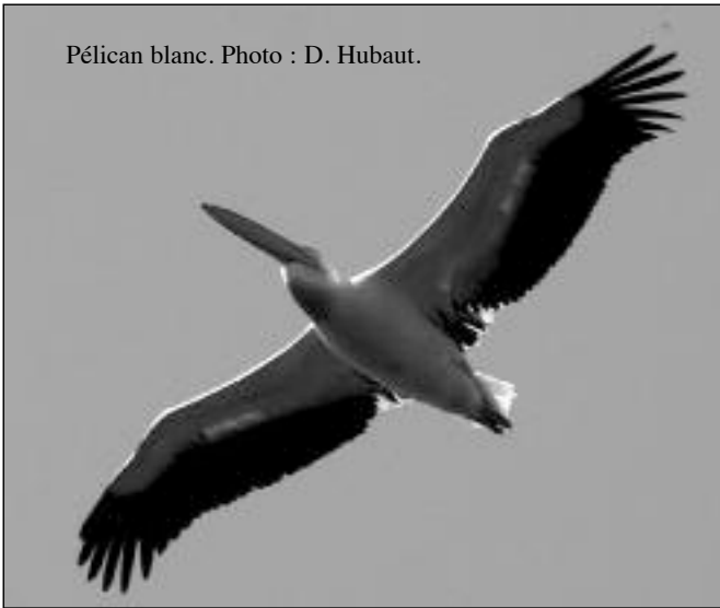
Pélican blanc.

Le pélican blanc est un oiseau de très grande taille : 1,40 m à 1,70 m de long, 2,50 m à 2,70 m d'envergure pour un poids de 10 kg. Il se sert de son bec comme d'une immense épuisette en basculant celui-ci dans l'eau à la façon des canards de surface ; observer la pêche collective d'une centaine de pélicans en eau peu profonde est un spectacle superbe, les oiseaux prenant en tenaille le banc de poissons qu'ils poursuivent ; ils sont bien souvent accompagnés de grands cormorans qui profitent de l'aubaine pour se nourrir ; l'envol de cet oiseau est particulièrement impressionnant et il flotte dans l'air de façon extraordinaire avec une économie de moyen fantastique pour