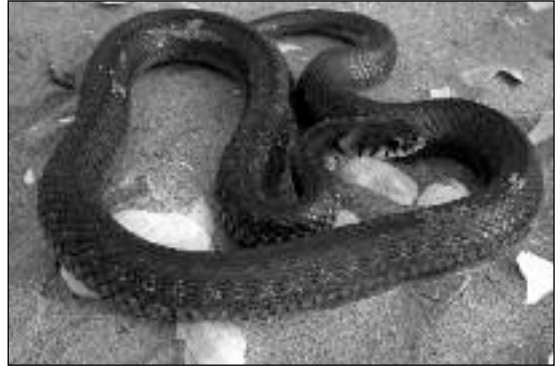
Couleuvre tessellée.

Le delta du Danube est traversé par le 45 e parallèle de l'hémisphère boréal, situé à mi-distance entre l'équateur et le pôle Nord, carrefour idéal pour les oiseaux migrateurs. La plus représentative de ces espèces et la plus exceptionnelle en Europe est certainement le pélican, dont deux espèces vivant en sympatrie sur le delta du Danube en quantité telle que ce seul argument suffit à protéger intégralement cette zone d'Europe, capitale pour ces espèces dont le rare pélican frisé (200 couples en Roumanie au début du xx e siècle) avec aujourd'hui une population estimée à une centaine de couples sur les 3 000 couples environ que compte encore le monde. En ce qui concerne le pélican blanc, sa population n'est pas spécialement menacée au vu de son importante population africaine estimée entre 40 000 et 75 000 couples. Dans le delta, les derniers recensements ont permis d'établir une population de 2 500 à 3 000 couples nicheurs, mais il existe de nombreux oiseaux immatures qui vivent sur les lacs avant d'atteindre la maturité sexuelle pour nicher. La principale colonie de pélicans blancs niche au nord du complexe du delta au bord d'un lac strictement protégé dans la réserve de Rosca-Buhaiova; ils établissent leurs nids sur ces amas de végétation déjà décrits plus haut, les « plaurs » qui présentent le double avantage de ne pas être facilement accessibles aux mammifères prédateurs des œufs et des jeunes et d'être à l'abri des variations du niveau des eaux.