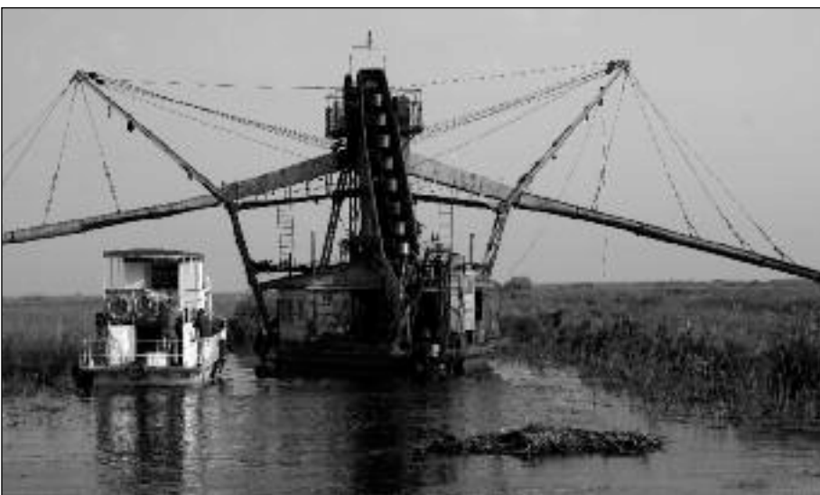
L'entretien des canaux

Le martin-pêcheur s'observe partout où la berge est érodée par les eaux du Danube et il est étonnant de voir des nids installés à 15 cm au-dessus du niveau des étroits chenaux à l'abri des fluctuations du fleuve, à l'endroit où le pêcheur vient occasionnellement accoster sa barque. Dans certaines parties du vieux Danube, on peut y voir un véritable ballet de flèches bleues qui alarment au passage des bateaux.