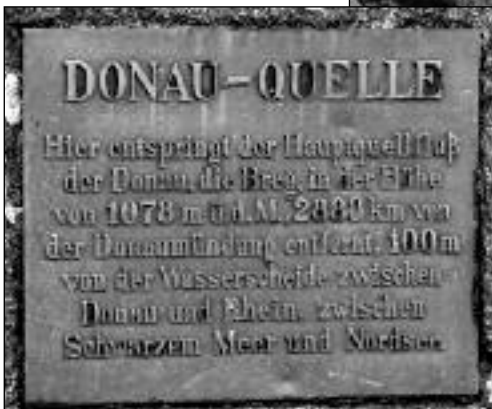
La source principale du Danube, entre Schönwald et Furtwangen (Forêt Noire).

*Photographe animalier, assistant au Centre Marie-Victorin.