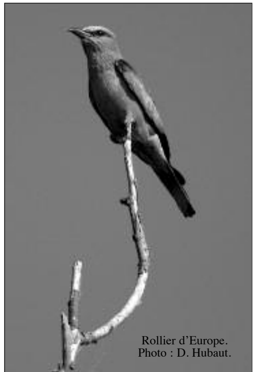
Rollier d'Europe.

Un parfait indicateur de la richesse de ces milieux en insectes est sans nul doute la présence par centaines de couples de la pie-grièche écorcheur et de la pie-grièche à poitrine rose : le seul chiffre de l'abondance estimé en Roumanie laisse pantois : 800 000 couples nicheurs de pie-grièche écorcheur en Roumanie pour seulement 100 000 couples en France, 2,5 fois plus grande que la Roumanie (1 500 à 2 000 couples en Belgique les bonnes années) ; 45 000 couples de pie-grièche à poitrine rose en Roumanie concentrés en Dobrogea et dans le delta pour 30 couples dans le sud de la France. Cela suscite la réflexion pour démontrer à quel point nous avons modifié profondément nos campagnes et nos milieux les plus divers et qu'il serait fort malheureux que l'adhésion à l'Europe (et à l'Europe verte de la rentabilité) ne transforme rapidement ces pays de l'Est en un désert biologique. Mais pour terminer en beauté, évoquons ici le véritable enchantement que provoque en nous la vision d'une dizaine de loriots d'Europe dont les jeux amoureux animent au printemps les grands arbres le long des berges de ce splendide fleuve qui n'a pas encore perdu toute sa splendeur.