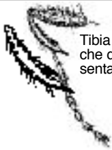
Tibia antérieur de la Mouche de Saint-Marc présentant 2 grandes épines)