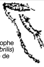
Tibia antérieur de Dilophe précoce ( Dilophus febrilis ) muni d'une couronne de petites épines

Les femelles des Bibionidés utilisent leurs épines tibiales pour creuser dans la terre molle une galerie de quelques centimètres dans laquelle seront déposés 200 à 300 œufs.