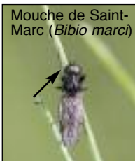
Mouche de Saint-Marc ( Bibio marci )