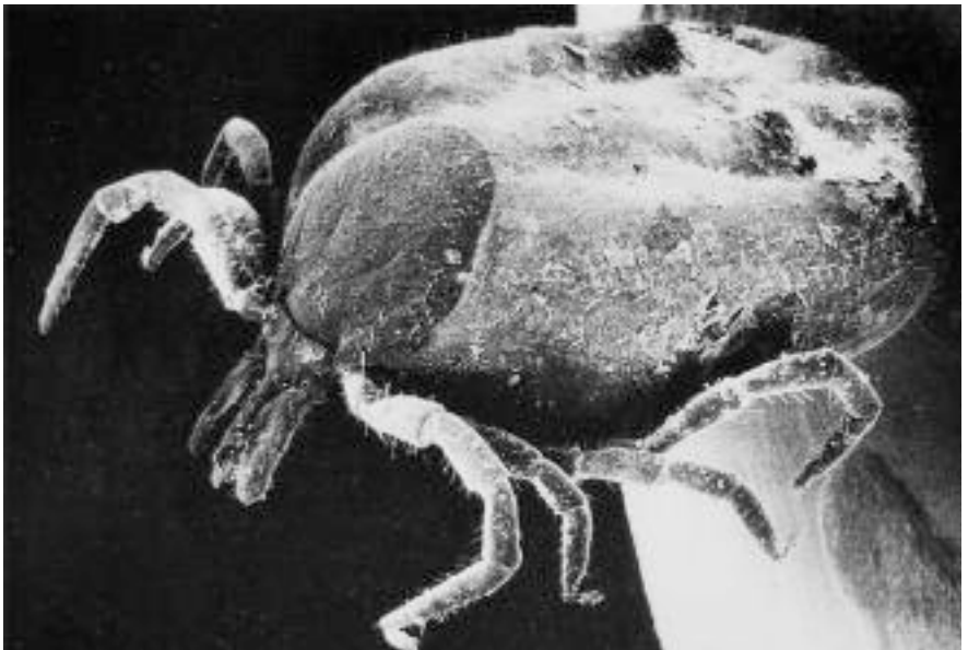
Ixodes ricinus . (© Devos).