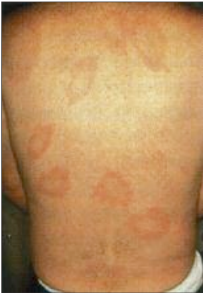
Lésions disséminées d'érythème migrant (rarement, plusieurs lésions cutanées peuvent apparaître après l'érythème initial)