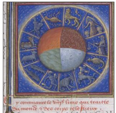
Les 12 signes du zodiaque. Enluminure. Barthélemy l'Anglais. xv e siècle

Les Chinois aussi en 400 av. J.-C. font des tables très précises. Les astronomes de l'Empereur doivent régler la vie agri-