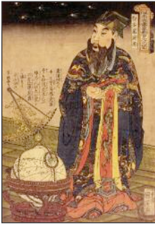
Astronome chinois. Peinture. 1675