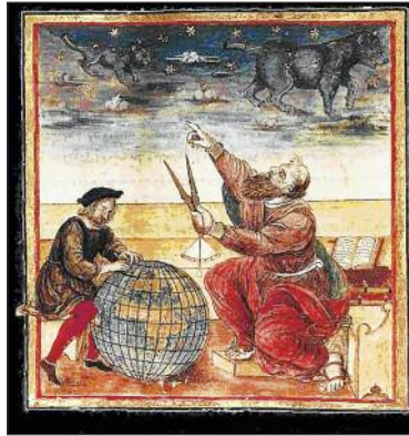
L'astronome grec Ptolémée étudiant les constellations

Pourtant pendant mille ans et jusqu'au Moyen Âge, l'Occident chrétien oublia le savoir de ces philosophes et retint les écrits d'autres grecs comme Aristote (384-322 av. J.-C.) et enfin Ptolémée, qui vers l'an 140, propose un système de l'univers dans lequel la Terre est immobile au centre et le soleil et les planètes tournent autour d'elle. Cela s'appelle le système géocentrique et cela correspond mieux à ce qui est écrit dans la Bible. On retient donc cette idée chez nous.