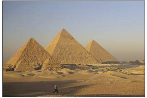
Pyramides de Kheops, Kephren et Mykerinos (plateau de Gizeh – Égypte) 2500 av. J.-C.

cole du peuple et le calendrier impérial. Gare à eux s'ils se trompent dans leurs calculs : ils sont immédiatement exécutés !