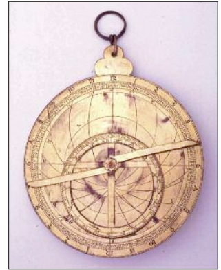
Astrolabe. Fabriqué en Allemagne au xv e siècle

Les chrétiens oublient mais les Arabes musulmans lisent les Grecs (ainsi que les traités venant d'Inde et de Chine). Pour eux, étudier la nature est un devoir sacré. Les astronomes reçoivent de l'argent pour leurs recherches. Les califes fondent des « Maisons de Sagesse » où l'on étudie l'algèbre, la trigonométrie, la géométrie, la chimie, la botanique et l'astronomie. Ils fabriquent ou perfectionnent des appareils de mesure comme l'astrolabe (un héritage des Grecs). Il s'agit de plaques métalliques superposées que l'on fait tourner et qui permettent de trouver la position des objets célestes, l'heure de lever et coucher des étoiles, quel que soit le jour, l'heure ou l'endroit où l'on se trouve ! Plus tard cela servira de « GPS » aux grands navigateurs européens de la Renaissance à la découverte de nouvelles terres.