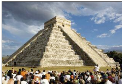
Pyramide de Kukulkan à Chichen Itza (péninsule du Yucatan – Mexique) XII e siècle