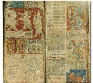
Codex de Dresde. XV e siècle

Tu vois, malgré l'absence de systèmes optiques pour regarder ou d'ordinateurs pour calculer, tous ces peuples ont fait des observations exactes et prévoyaient même des phénomènes particuliers comme les éclipses. Ils ont un autre point commun : ce qu'ils voyaient était mystérieux et dépendait des dieux. L'astronomie servait à fixer un calendrier agricole et surtout à faire des prédictions comme le fait l'astrologie. Donc la croissance et la magie y tenaient une grande place.