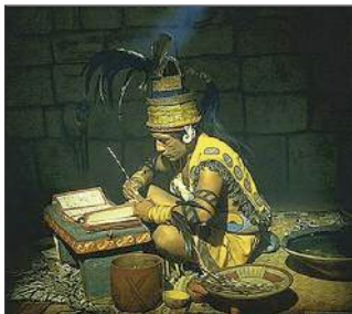
Prêtre et scribe Maya devant un codex

L'écriture Maya est presque entièrement déchiffrée : on peut donc lire ce qui est écrit sur les pierres des monuments, sur les stèles ainsi que dans leurs livres (les codex) qui sont des rouleaux de fibres végétales. Il n'en reste que quatre car les milliers d'autres ont été brûlés lors de la conquête espagnole. Le codex de Dresde dont tu vois une image ci-dessous à droite contient le nom des jours et des divinités bonnes ou moins bonnes associées à chaque jour. Éclipses et observations astronomiques y sont mentionnées.